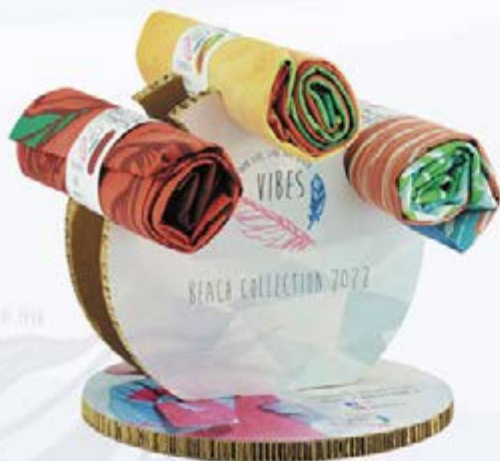
ESPOSITORE PER TELI