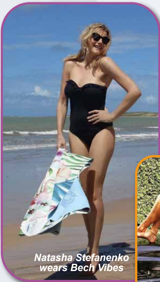
Natasha Stefanenko wears Bech Vibes

Realizzazione di materiale visivo: cartoline, cataloghi, espositori, brochure, cartelli vetrina